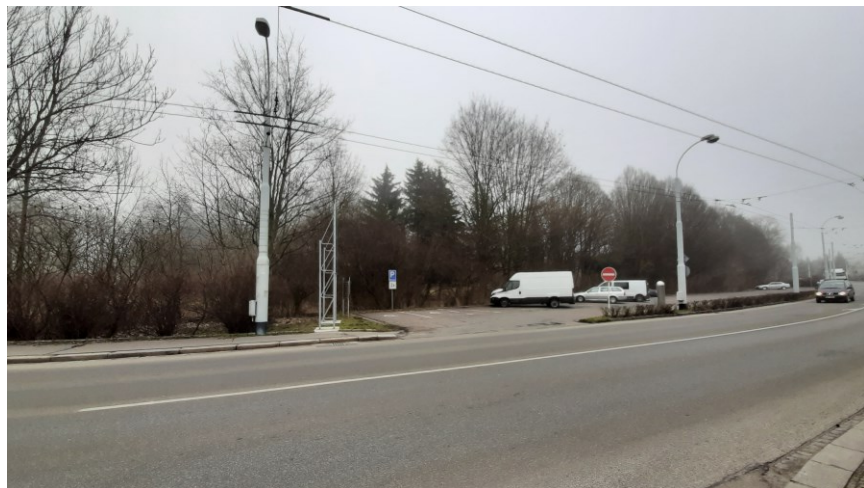
Pátevní komunikace II/211