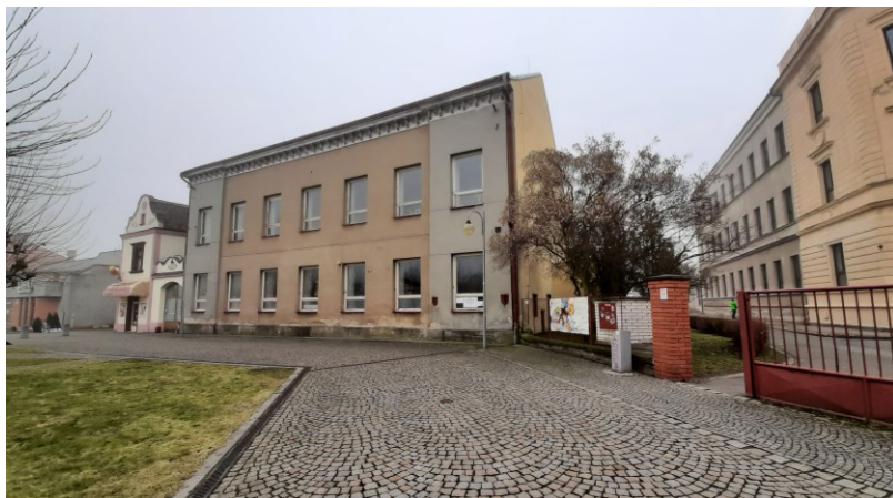
Objekt bývalé školy a nevyužívaná kotelna