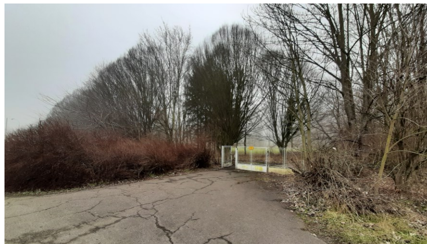
Vstup do lázeňského parku