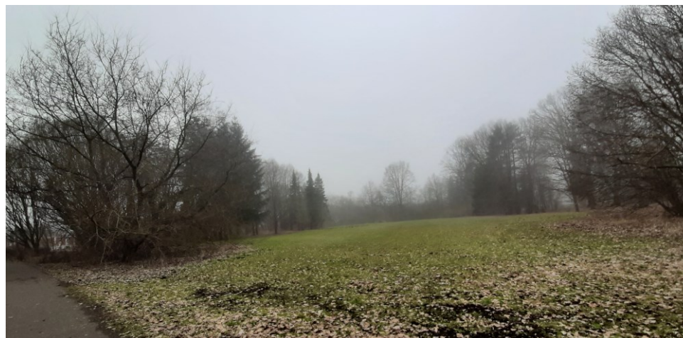
Volně rostoucí zeleň